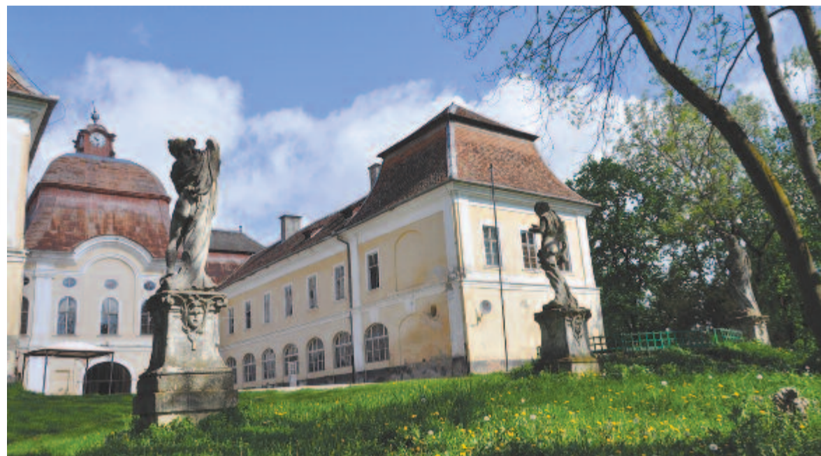
A gerneszegi Teleki-kastély