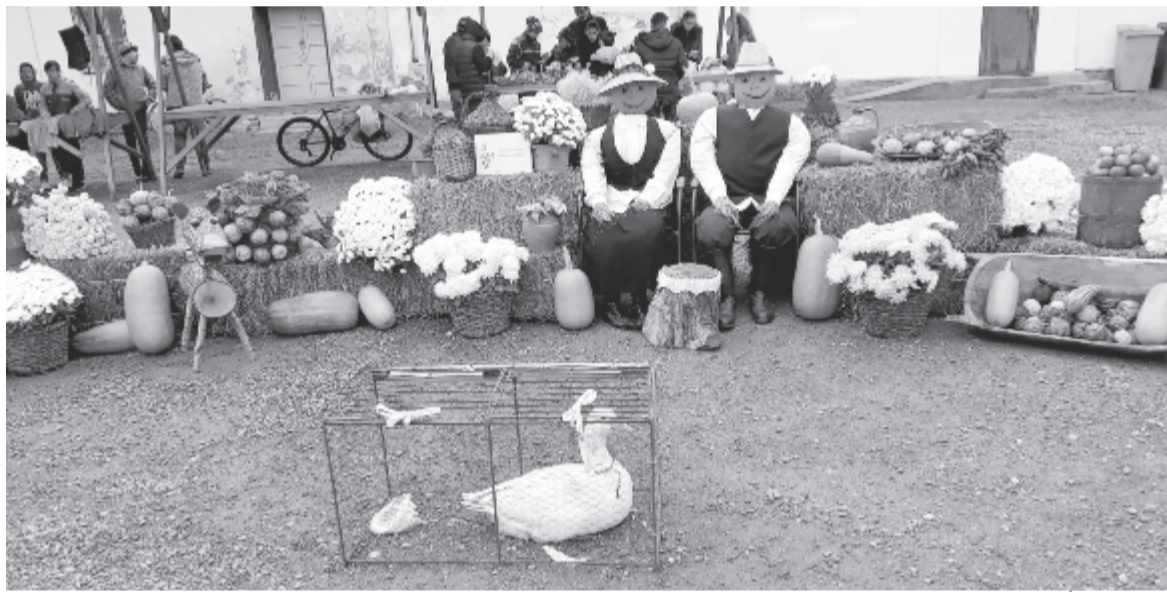
Negyedszer tartottak vásárt a szentgyörgyi kastélyudvaron