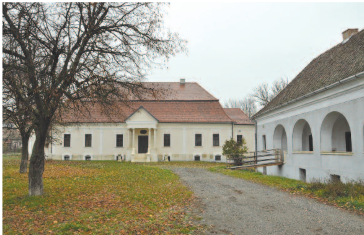
A vajdaszentiványi Zichy-kastély

amely a következőkből áll: verbunk, sebes forduló, lassú, korszos, csárdás és a batuta, batuka. A tánc-táborba nemcsak a néptáncot és népzenei kedvelőknek érdemes elmenni, mivel a táncoktatás mellett számos más, a helyi kulturális örökséget előtérbe helyező programmal várják a vendégeket a szervezők.