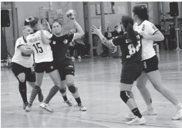
Későre bátorodtak fel annyira a kézpünkön támadó Olimpic játékosai, hogy felvehesék a versenyt az ellenféllel.

Elszenvedte első vereségét hazai pályán a Marosvásárhelyi Olimpic a női kézilabda A osztály B csoportjában. A 11 gólos különbség eltűzöttnek tűnik, azonban a 15-16 éves marosvásárhelyi lányok kissé megszepentem kezdték a mérkőzést, aztán a második féldő elején is volt egy 1-9-es sorozat, amikor az Olimpic