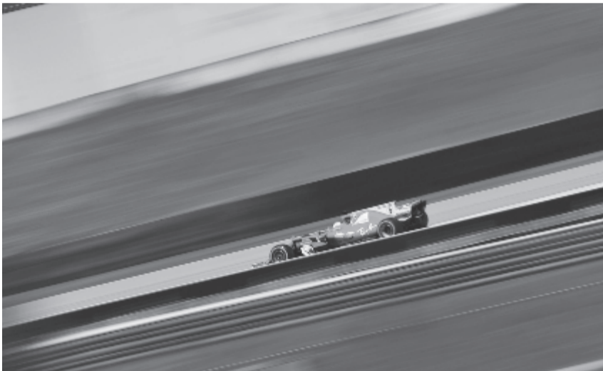
A négyszeres világbajnok német pilóta 2010 és 2013 után harmadszor győzött Sao Paulóban

A vb két hét múlva, az Abu-Dzabi Nagydíjjal fejeződik be.