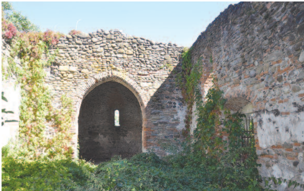
A felfalui régi templom romjai

József gróf alakította át angol stílusú parkká a múlt század elején. Érdekessége a parkban található több száz éves ginkófa vagy páfrányfenyő (Ginkgo biloba). E faj élő kövületnek számít, nincsenek