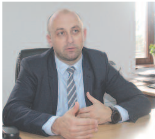
Radiológiai és sürgősségi részleget terveznek

Ezzel párhuzamosan járdaépítés is zajlik, jelenleg a megújult Nyárád-hídtól Andrásfalva felé nyolcszáz méteres szakaszon dolgoznak, egyelőre a vasútig helyeznek le új járdaalapokat, és napokon belül elkezdik a járdaépítést a hivatal és a hentesbolt közötti szakaszon. A munkálatokat a költségvetés függvényében szakaszokban végzik, évente másfél kilométer járdát tudnak elkészíteni.